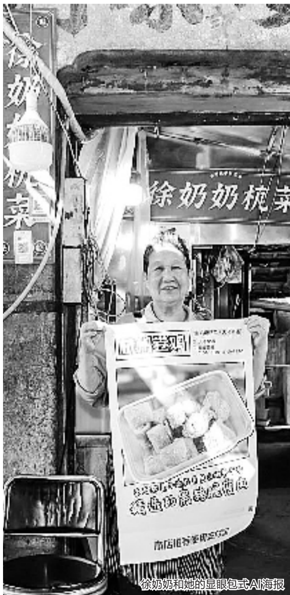
徐奶奶和她的显眼包式AI海报

据了解,8月31日文心一言面向全社会开放至今,用户规模已经达到7000万,场景4300个。