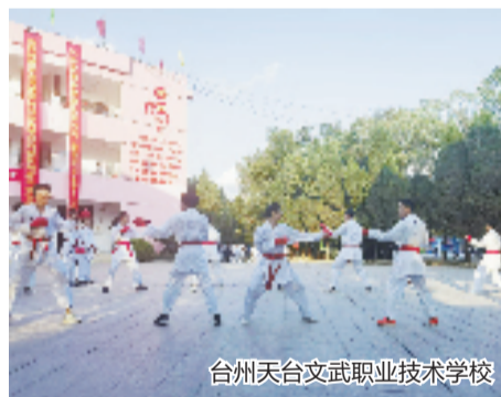
台州天台文武职业技术学校