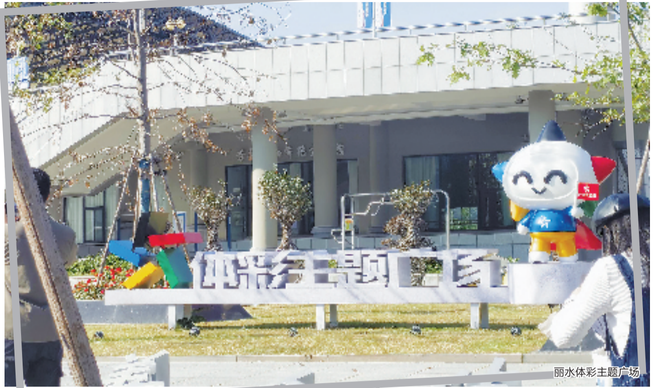
丽水体彩主题广场

近日,由国家体彩中心开展的“汇聚微公益 添彩新征程”——优秀体彩公益金资助项目宣传报道系列活动先后走进浙江,十余家中央主流媒体及行业媒体组成的采访团先后深入台州、丽水、杭州等地,通过实地走访,共同见证公益体彩为百姓共富的美好生活添彩助力。