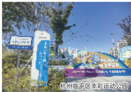
杭州临平区丰彩运动公园

比如在台州临海市,自2014年开始举办柴古唐斯括苍越野赛以来,在体彩公益金的支持下,赛事专业性不断提高,先后被评为“中国精品旅游赛事”、“浙江省十佳商业赛事”、“全省最具有潜力体育赛事”等荣誉。杭州余杭径山每年持续数月的“环浙步道”挑战赛成为国内户外运动的首创之举,截至目前已经吸引近20万人次到径山示范段打卡体验。