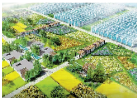
安吉农业高新区某智慧大棚种植基地

作为进驻浙江的首家股份制商业银行,浦发银行杭州分行积极服务浙江区域经济发展,通过不断完善经营体制,坚持丰富产品创新,优化提升服务水平,与民营企业合作共赢,为实体经济聚智赋能。作为普惠金融领域的先行者,浦发银行新近又推出“普惠+”30条举措,致力打造综合化普惠金融服务体系,走实走稳普惠金融高质量发展之路。