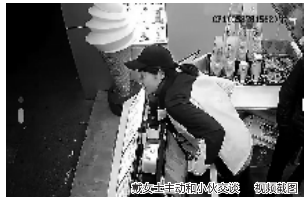
戴女士主动和小伙交谈 视频截图

这则视频火了后,众多网友点赞,也有人质疑戴女士是在炒作。“我问心无愧。”戴女士向记者表示,她玩抖音两三年,生活里的喜怒哀乐都会在网上分享。“当时店门口的监控拍下了这一幕,我就随手发到网上,根本没想过能火起来,以此来增加店里的收入。”戴女士说。 本报记者 陈薇