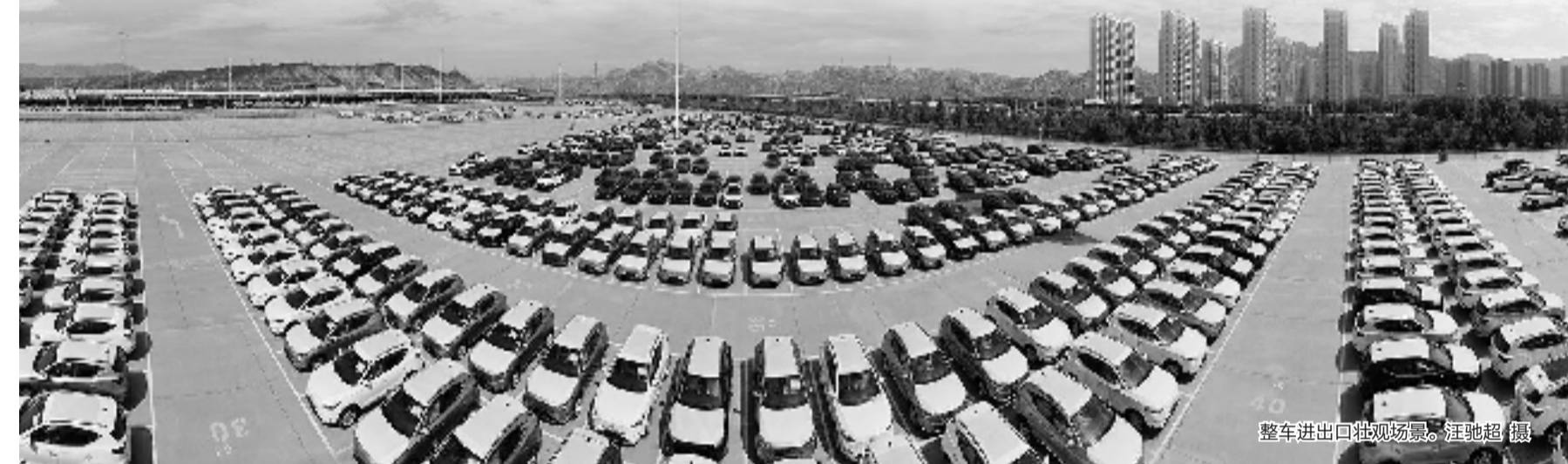
整车进出口壮观场景。

在“一带一路”的坐标节点上,兰州正在发挥其独特的地理优势沟通中外,架起经贸之桥、文化之桥和友谊之桥。