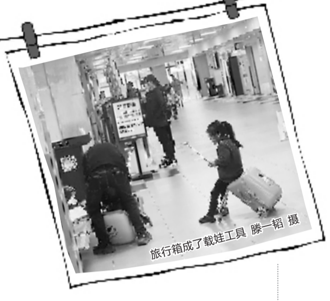
旅行箱成了载娃工具