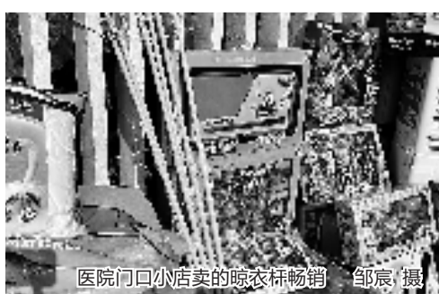
医院门口小店卖的晾衣杆畅销

箱。“箱子里能放东西,箱子上坐娃,遛起来蛮方便的。”这位家长告诉记者,自己是外地过来的,这种懒人旅行箱很实用。