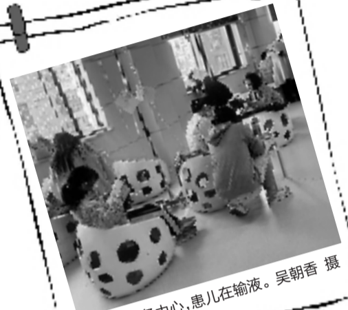
社区卫生服务中心,患儿在输液。