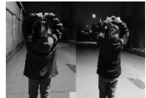
许大姐母女比心表示感谢