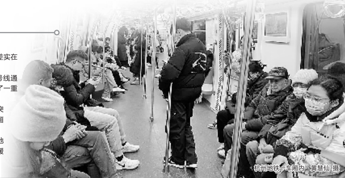
杭州地铁一车厢内

她便来求助钱报记者帮,想问问“冬天的杭州地铁,是否可以学学夏天的做法,设置强暖车厢和弱暖车厢?”