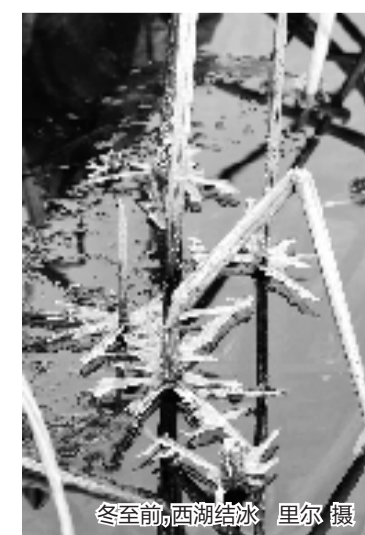
冬至前,西湖结冰。