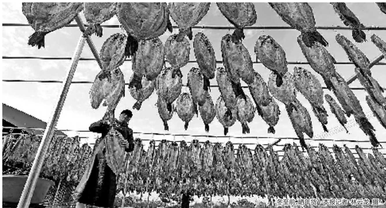
冬至前,晒年货。