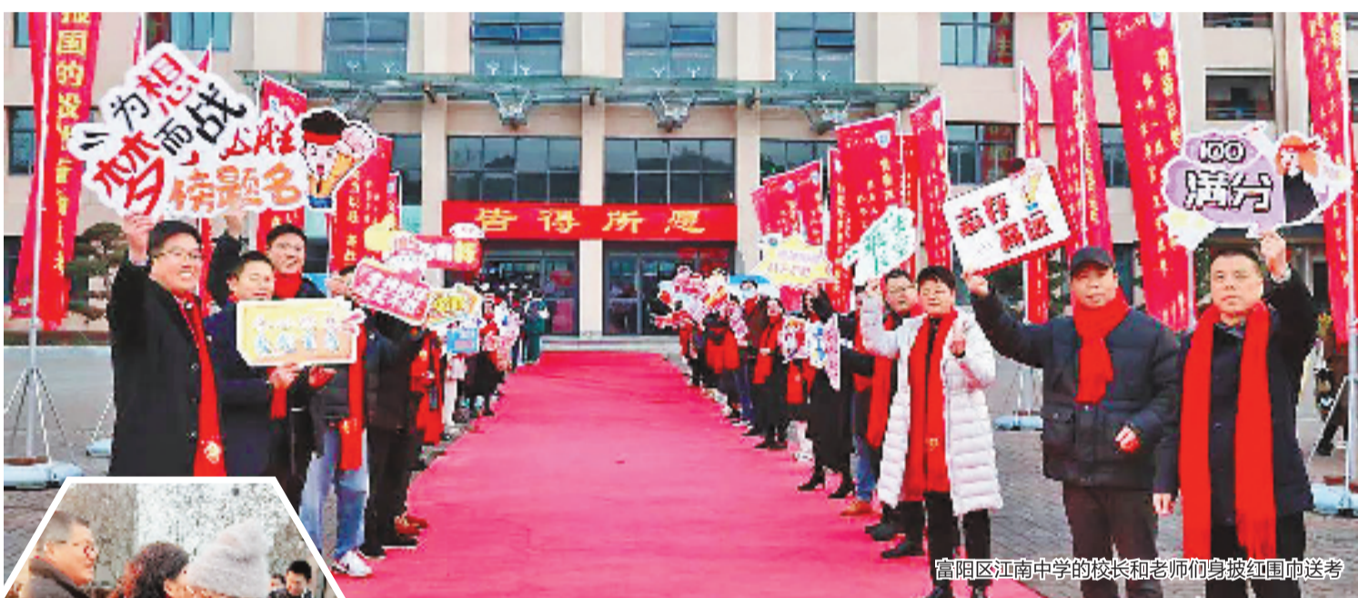
富阳区江南中学的校长和老师身披红围巾送考