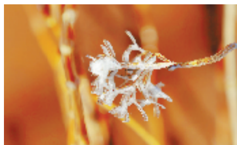
天台山顶雾凇