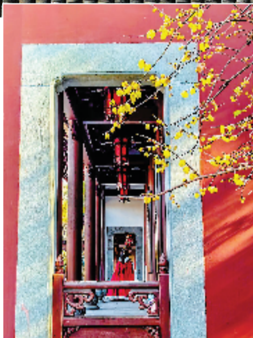
钱王祠蜡梅花开 @木木