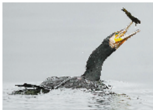
鸬鹚的美食 @青幼紫硕