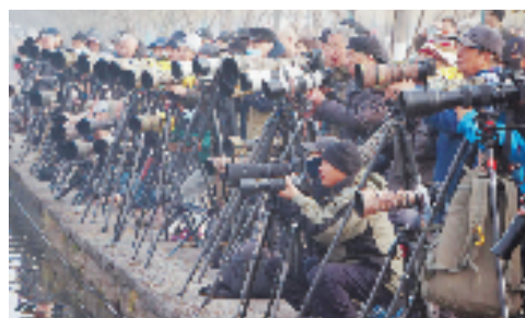
白堤旁的“长枪短炮”们在等待鸬鹚捕鱼