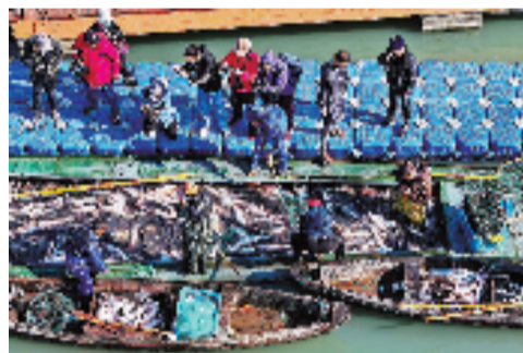
东钱湖冬捕