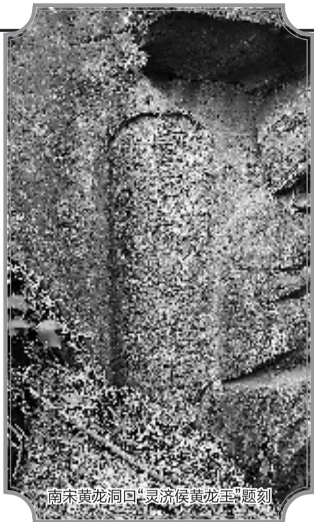
南宋黄龙洞口“灵济侯黄龙王”题刻