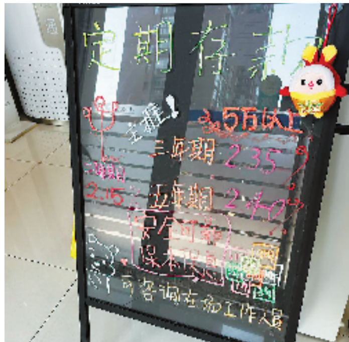
杭州一家国有大行网点大堂的存款利率告示板

“从长远看,在经济下行周期,各类资产价格下降,投资收益下滑,存款利率下降是大势所趋,在这种情况下,市民配置大额存单是稳妥的选择。”招联首席研究员董希淼表示:总体而言,大家应平衡好风险和收益的关系,再来综合进行资产配置,如果追求稳健收益,可以在存款之外,适当配置现金管理类理财产品、货币基金以及储蓄国债等产品。