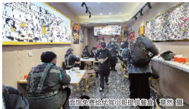
面馆免费给代驾小哥提供餐食