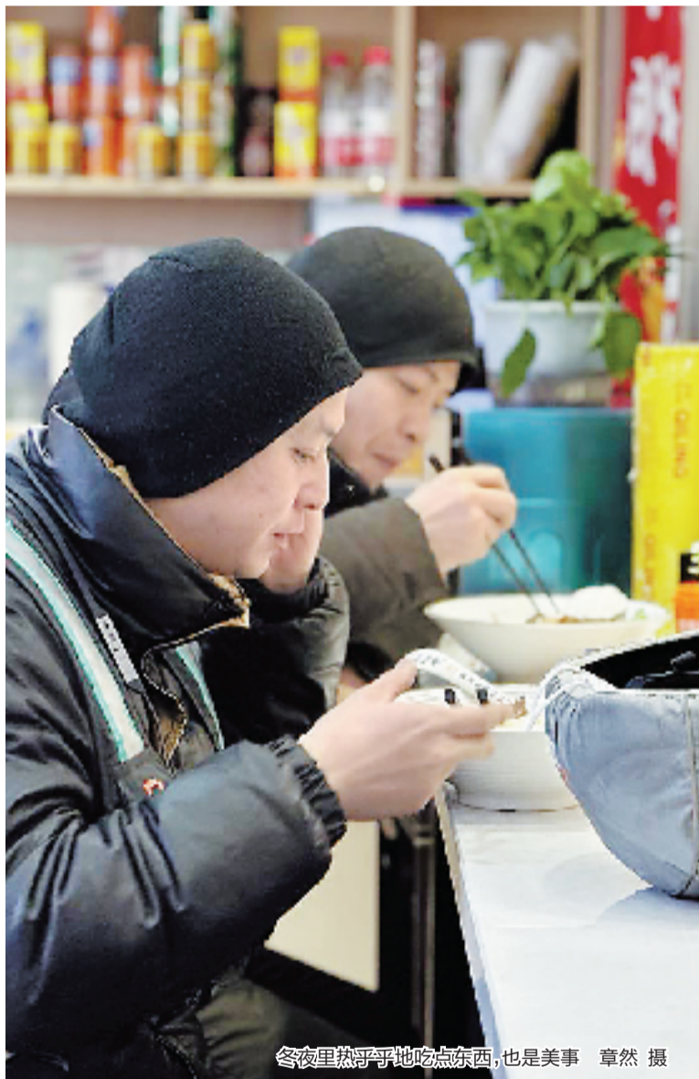
冬夜里热乎乎地吃点东西,也是美事