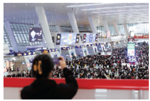
杭州东站返乡客流高峰已至