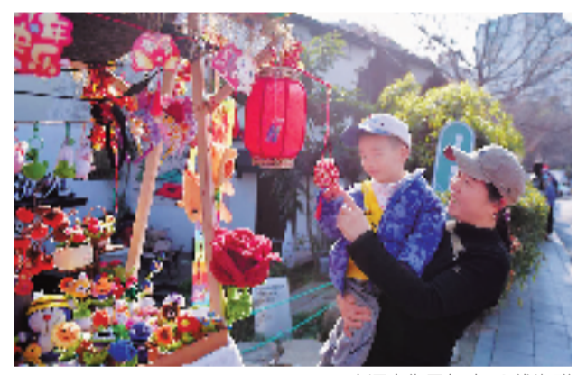
小河直街寻年味 @钱淑群