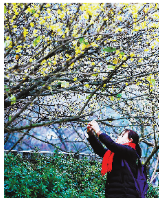
孤山一树蜡梅开