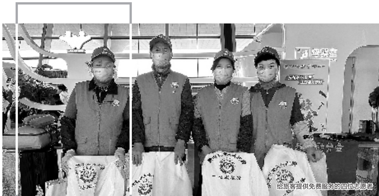
给旅客提供免费服务的四位志愿者