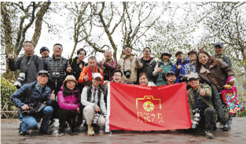
好摄之友春拍采风活动西湖边合影