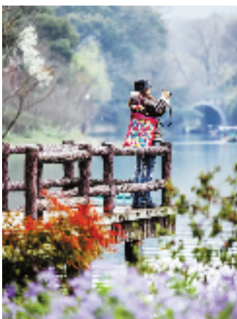
春拍西湖 @海纳百川