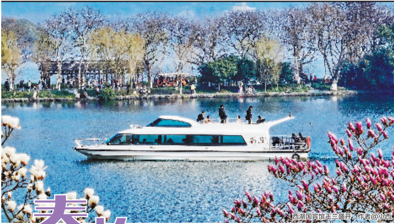
西湖国宾馆玉兰盛开