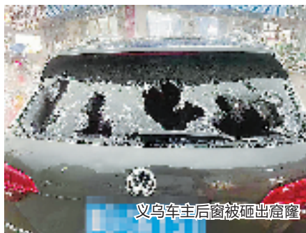
义乌车主后窗被砸出窟窿