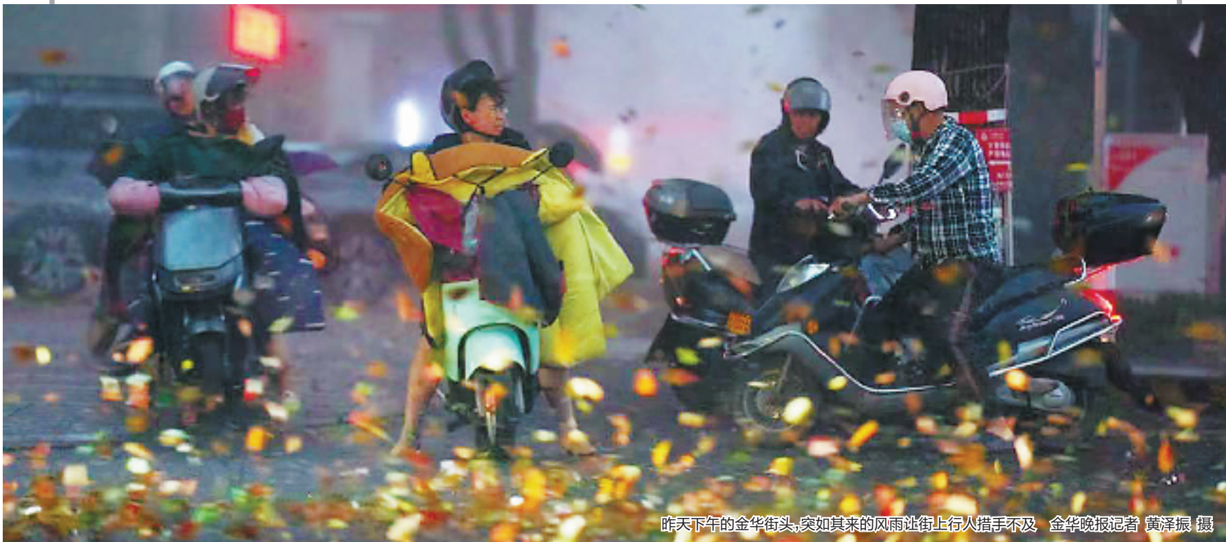
昨天下午的金华街头,突如其来的风雨让街上行人措手不及