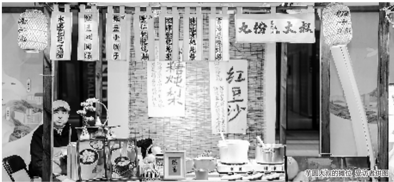
芋圆大叔的摊位