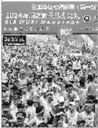
参赛选手在3小时内完赛。

而这只是这一年中马拉松狂飙好戏的其中一幕,这让人开始期待起今年夏天的巴黎奥运会。