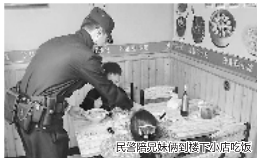
民警陪兄妹俩到楼下小店吃饭