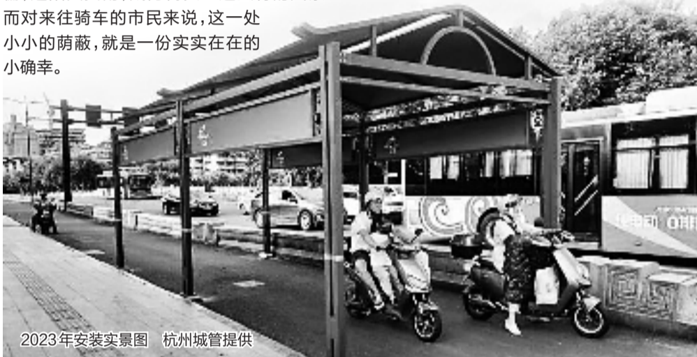
2023年安装实景图

每到5月份,杭城各大路口就会立起遮阳棚,遮阳又挡雨,成为街头一道独特的风景。而对来往骑车的市民来说,这一处小小的荫蔽,就是一份实实在在的小确幸。