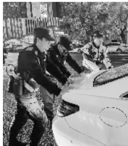
现场紧急处置

余女士赶紧下车。惊魂未定的她掏出手机,第一时间求助老公。老公此刻正好在开一个紧急会议。“我在开会,走不开,别慌,打110。”