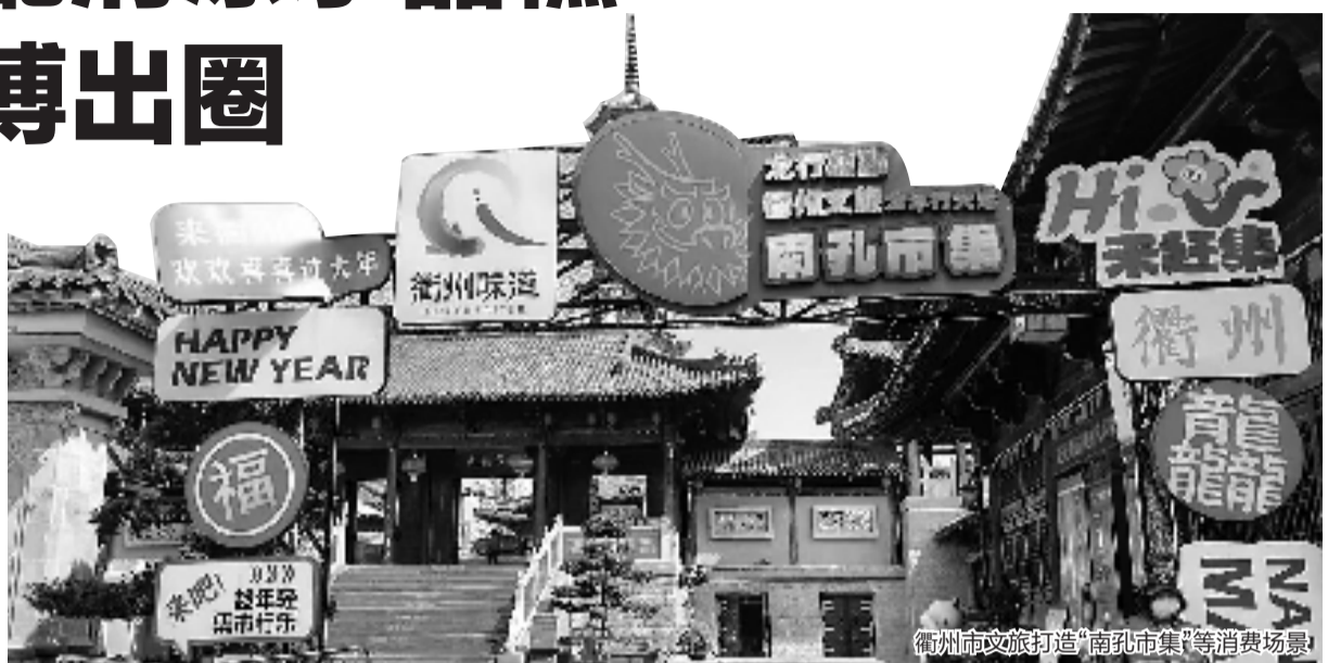
衢州市文旅打造“南孔市集”等消费场景