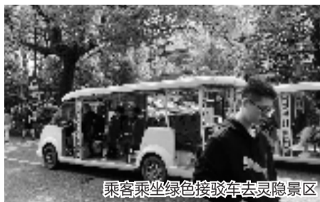
乘客乘坐绿色接驳车去灵隐景区

下了公交车,游客既可选择步行前往,也可以乘坐2元/人的绿色接驳车,直达景区售票处。记者坐上绿色接驳车,仅4分钟左右便到达目的地。