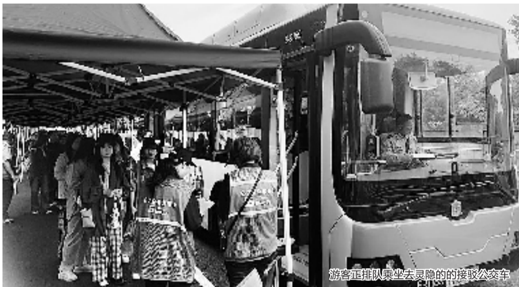
游客正排队乘坐去灵隐的接驳公交车