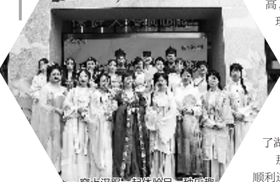
穿上汉服一起体验另一种乐趣