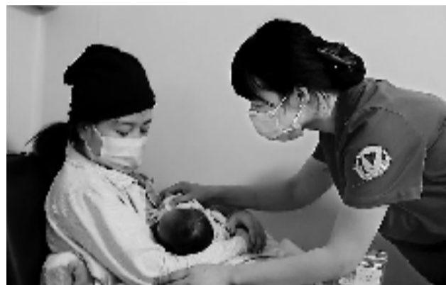
护士指导母乳喂养