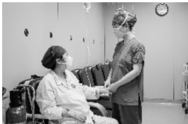
剖宫产也有导师师陪伴