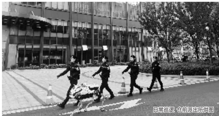
日常巡逻

这位警队新成员身份可不一般,是一只警用智能“机器狗”。它可不是“花架子”,当遇到险情或警情,人无法进入的地方,它可以代劳。