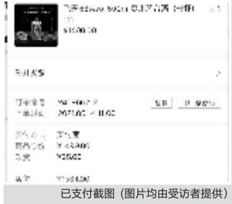
已支付截图(图片均由受访者提供)