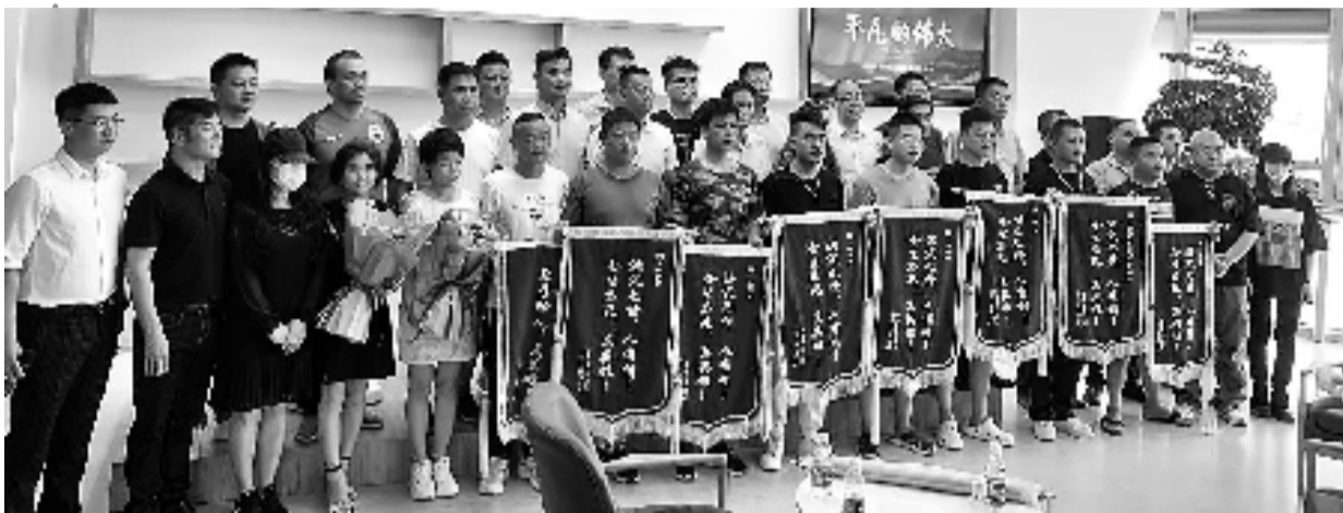
8位救援英雄参加了一场为他们举办的答谢会

昨天下午,在郑州图书馆的天中书院,8位参与郑州暴雨中一场生死救援的英雄,参加了一场为他们举办的答谢会。