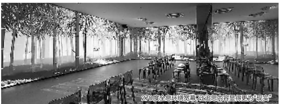
270度全息环绕宽幕,让追思内容显得更为“现实”

不少学者也指出,AI“复活”亲人虽是科技向善的体现,但也存在一系列隐患,比如可能面临隐私泄露的风险,以及由隐私泄露衍生的知识产权、财产权等问题,需要被重视。