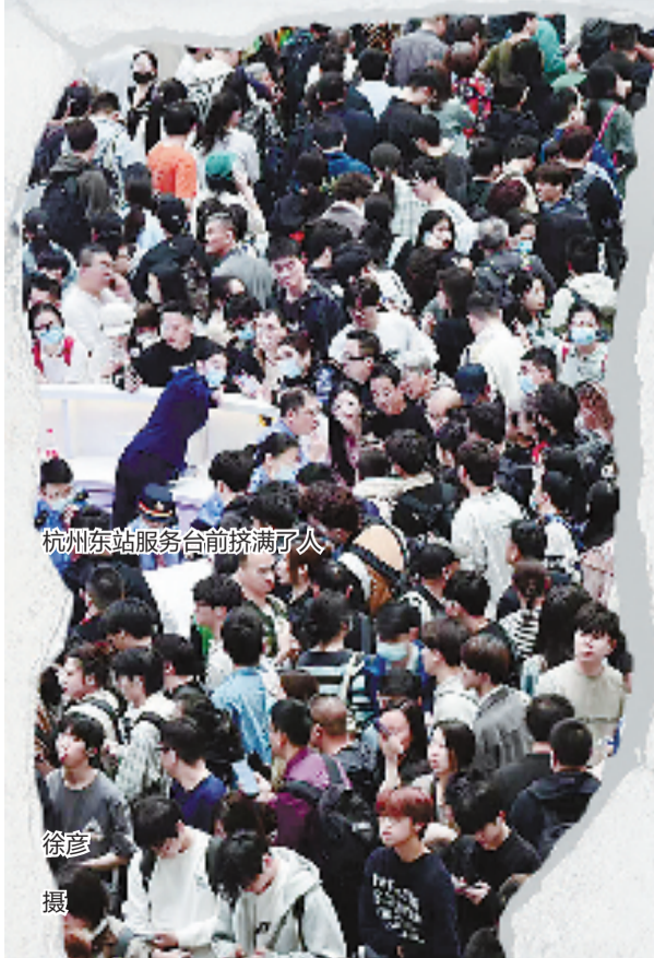
杭州东站服务台前挤满了人