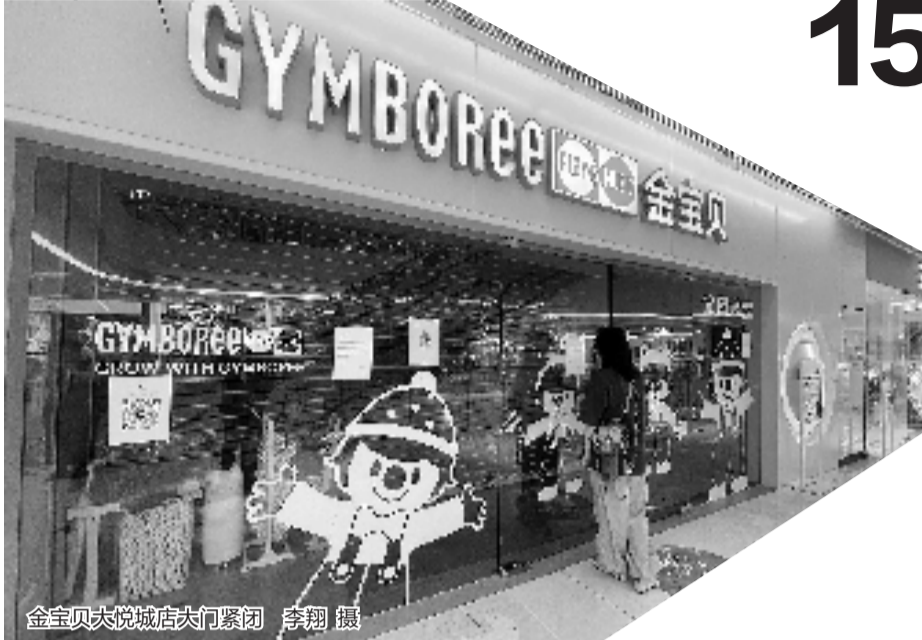
金宝贝大悦城店大门紧闭