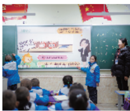
学校教室里有先进的硬件设施

“起初，学校没有围墙，屋顶漏雨漏雪，教室窗户几乎没有玻璃，上课时冻得直哆嗦。因家庭经济困难，同学们身上穿的都比较单薄。搬进窗明几净的新校舍后，同