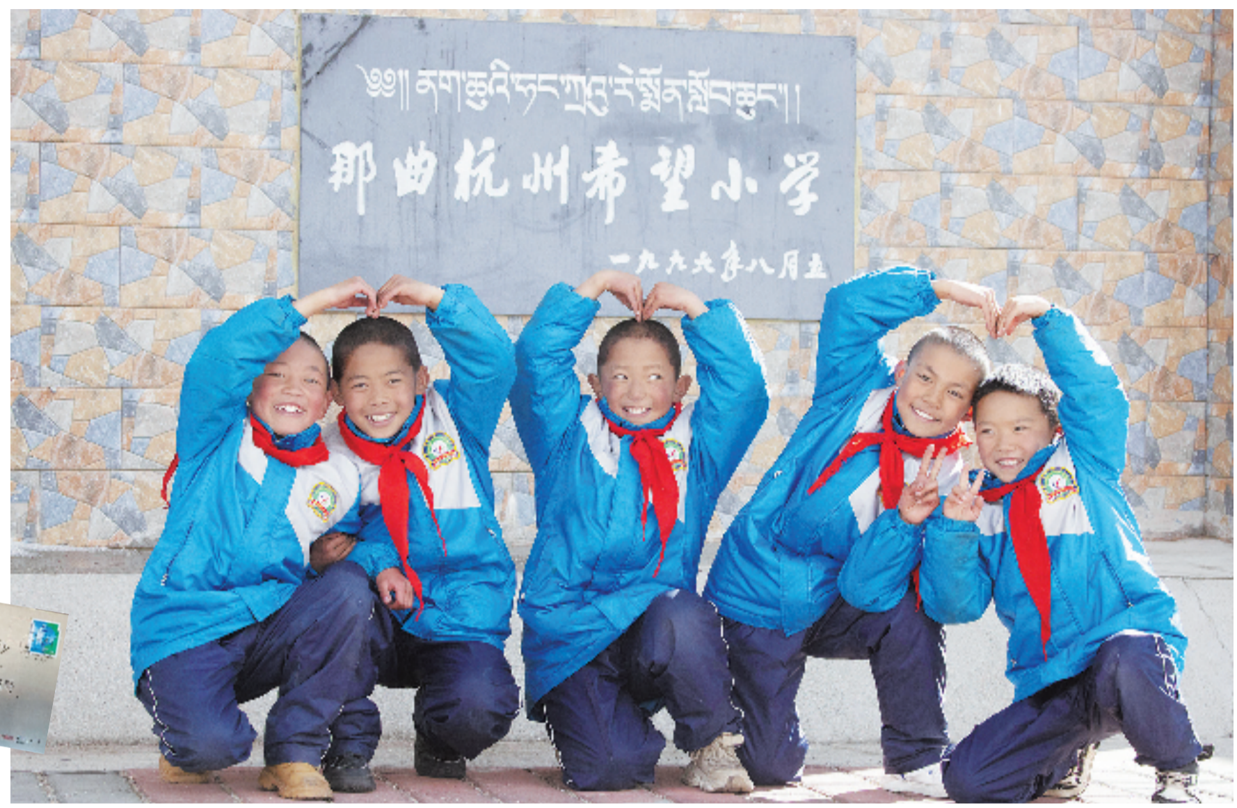
那曲香茂乡小学是当地第一批希望小学之一

之后，当“520”演变成表达爱意的日子，很多当年的援藏干部觉得，这个小小的巧合，照应着所有人对雪域高原最朴实的情意。