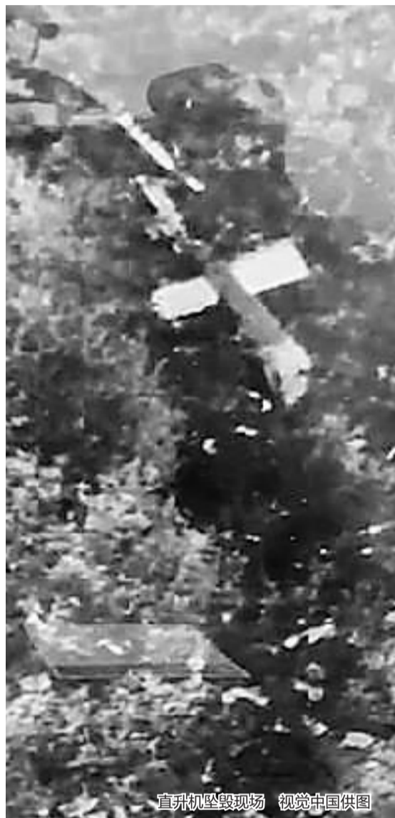
直升机坠毁现场