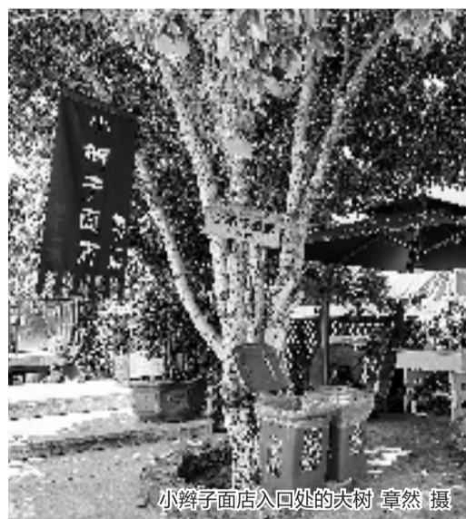
小辫子面店入口处的大树

开了13年,邱剑勇的“小辫子面店”一路走来并不容易。他是退伍军人,曾罹患鼻咽癌。面店2011年开张,一开始每天只能卖出5碗面,邱剑勇不断琢磨厨艺,才让回头客渐渐多了起来。现在生意好的时候,店里单日销量能有600到700碗,周末将近1000碗。