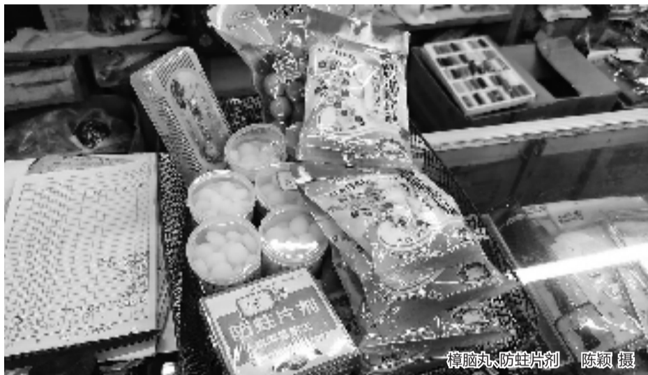
樟脑丸、防蛀片剂