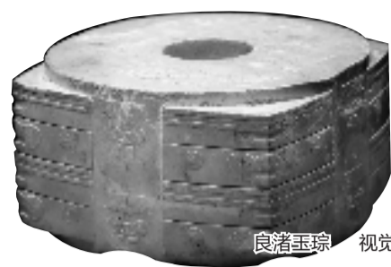
良渚玉琮