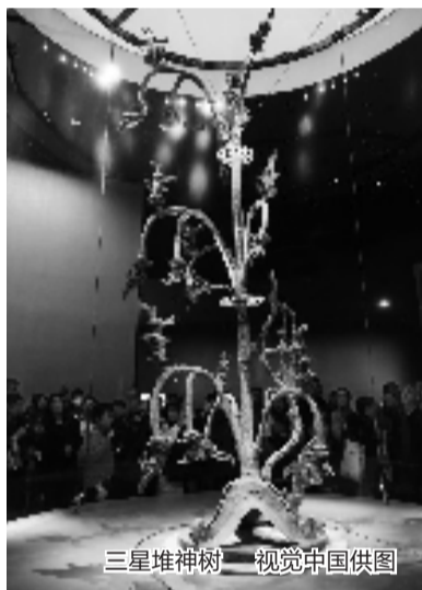
三星堆神树

实证中华文明5000年的良渚,和创造璀璨“青铜时代”的三星堆,它们有着什么样千丝万缕的联系,又怎样共同书写中华文明绵延不绝的绚丽篇章?