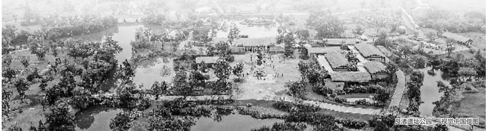
良渚遗址公园