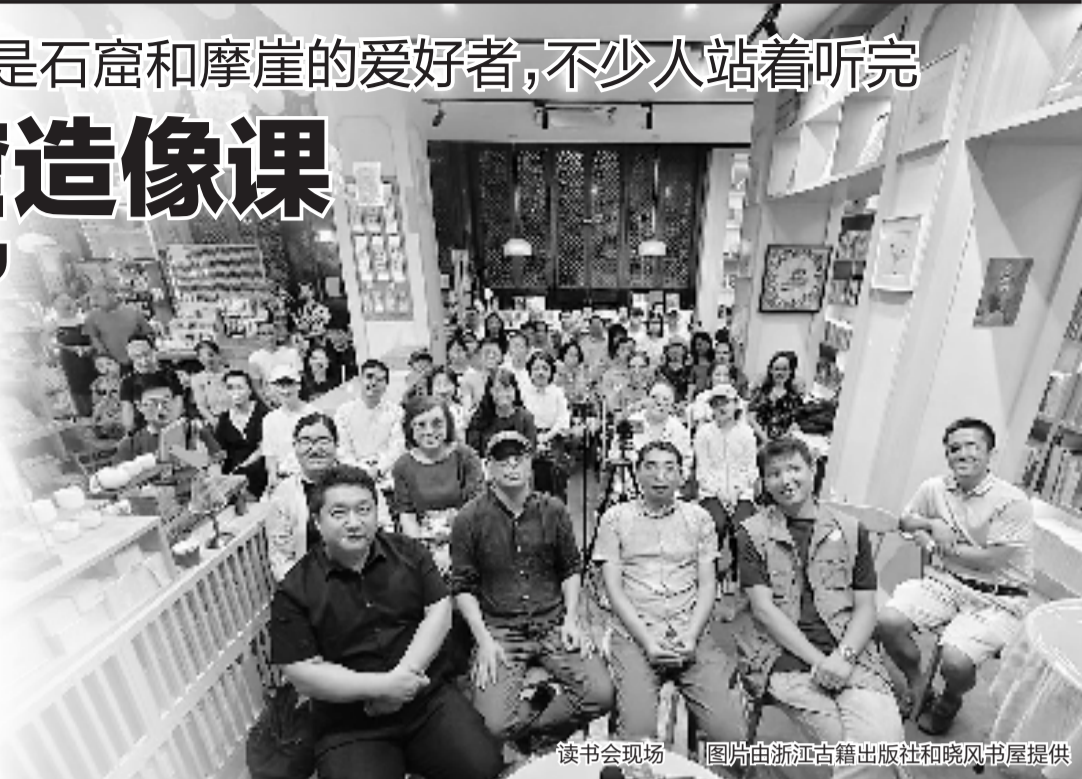
读书会现场

这个夜晚,弥陀寺公园里的晓风·明远BOOK搬出了全部备用的折叠椅,两侧过道还站着不少人,很多人站着听完了这堂两个多小时的“浙江石窟造像课”。