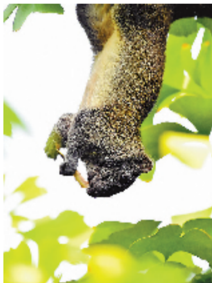
瓜熟果香,小松鼠最活跃的季节 @辰曲