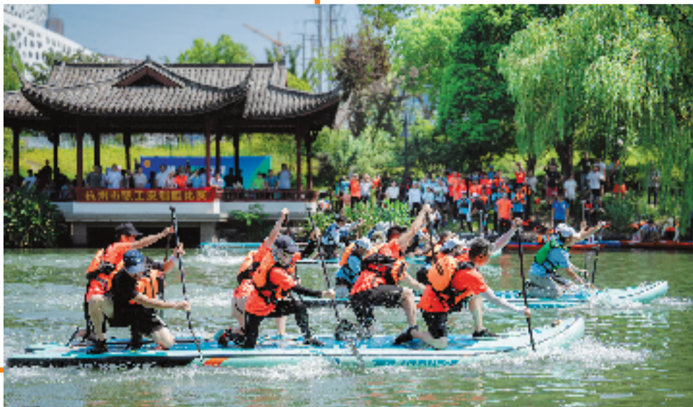
皮划艇赛正当时