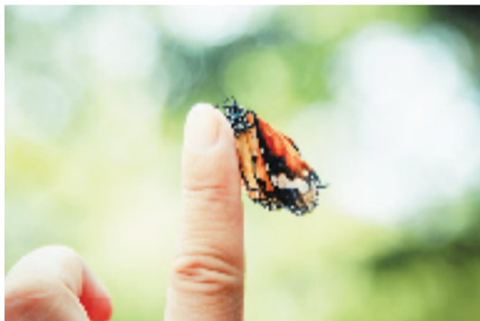
等待凉爽的秋风 @芦苇