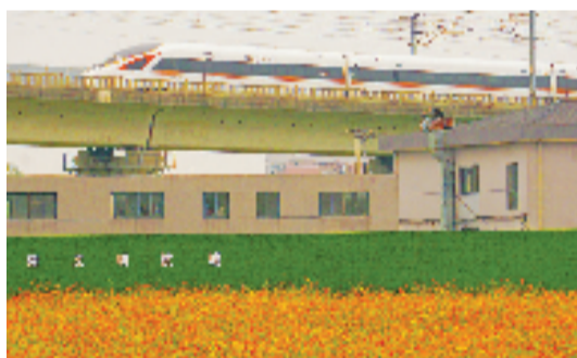
城郊,大片的波斯菊绽放