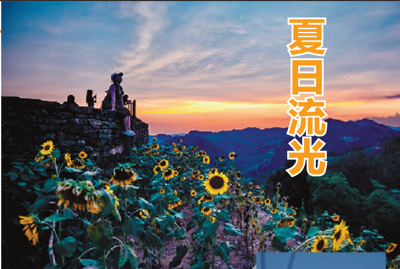
霞光下的向日葵 @龚军勇

本期好摄之友,我们邀请爱拍照的你,举起相机走到户外,用镜头抓住每一个季节变幻的讯息。