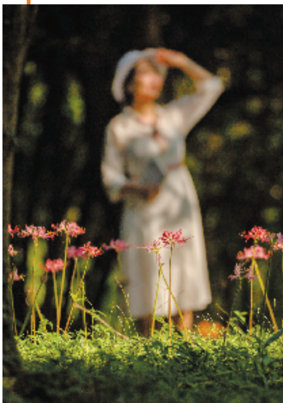
西湖边,大片的彼岸花绽放 @大头狐狸