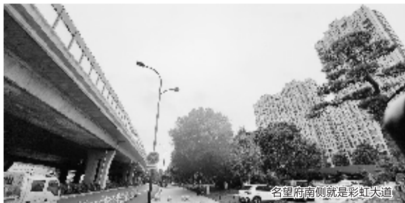
名望府南侧就是彩虹大道