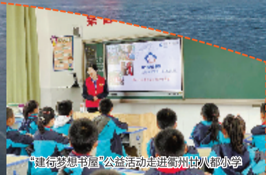
“建行梦想书屋”公益活动走进衢州廿八都小学