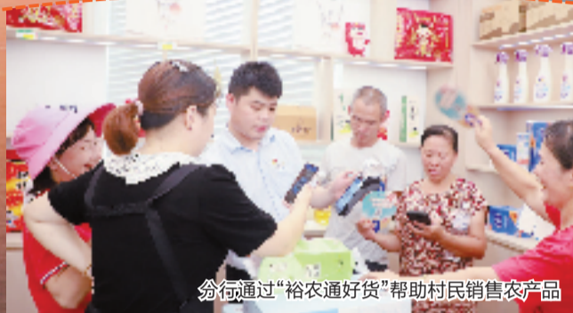
分行通过“裕农通好货”帮助村民销售农产品