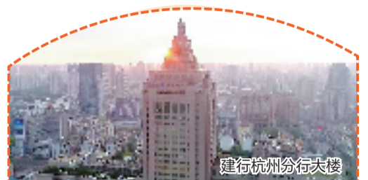
建行杭州分行大楼

勇立潮头敢为先,奋楫扬帆谋新篇。站在70年的崭新节点上,建行杭州分行将继续把握金融工作的政治性、人民性,进一步发挥好金融“精准灌溉”的作用,做实做细金融“五篇大文章”,为杭州经济社会的高质量发展再添锦绣与繁华。