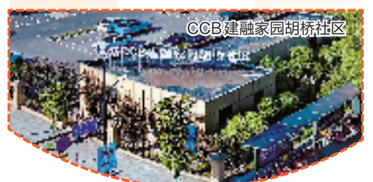
CCB建融家园胡桥社区