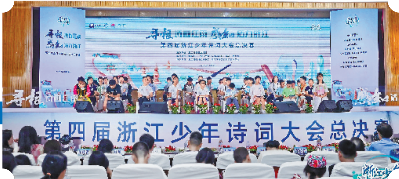
第四届浙江少年诗词大会全省年度总决赛现场

第五届浙江少年诗词大会报名通道已经开启,大会日常安排也已经出炉。大家注意赛事时间,扫二维码,关注“升学宝”微信公众号,点击底部下沉菜单“诗词大会”,报名参加活动,千万别错过。