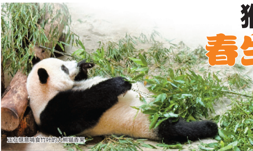
正在惬意啃食竹叶的大熊猫香果