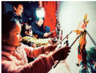
皮影戏体验

内容:以“迎春朝喜”“如愿祈福”“臻禧食坊”“关扑游集”“全民福星”“非遗共赏”等新春活动,点燃节日狂欢之火。在景区可以参与剪纸、拓印年画、水印花笺、皮影戏观看等各类文化体验。