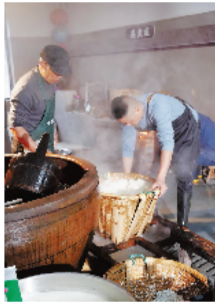
“宋小姐别院”酿米酒体验